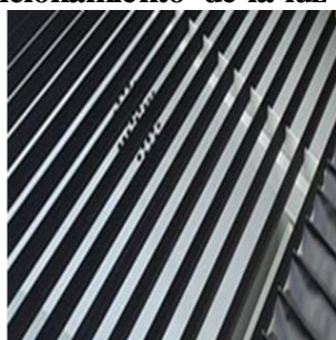
Mesa de trabajo