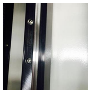
Guía carril cuadrado