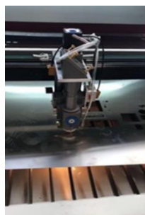
Láser cabeza con el posicionamiento de la luz roja