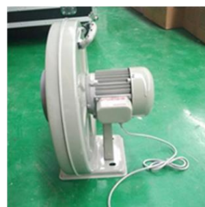
Extractor de aire y humo